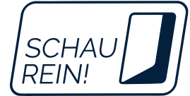
FOTO-, TON- UND VIDEOAUFNAHMEN

Ich, _____, VORNAME, NACHNAME: SCHÜLERIN/SCHÜLER BZW. SCHAU-REIN!-TEILNEHMERIN/TEILNEHMER IN BLOCKBUCHSTABEN ODER VORNAME, NACHNAME: ELTERN BZW. PERSONENSORGEBEBERECHTIGTE, WENN KIND UNTER 18 JAHRE ALT IST